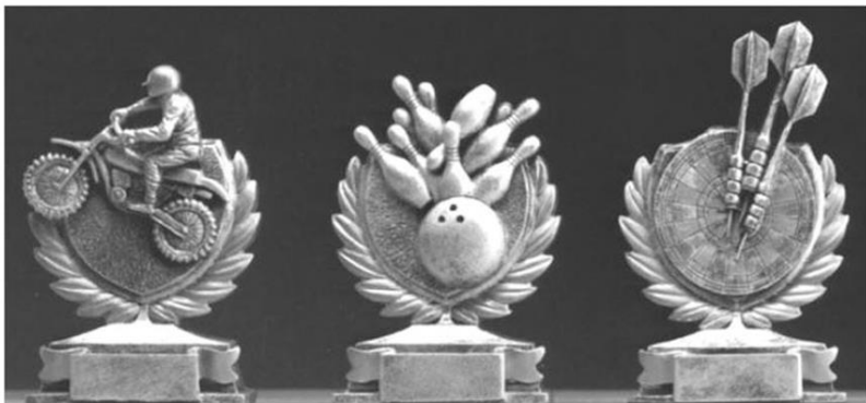
Gravuren · Zinn · Medaillen Schiefer · Keramik · Barometer · Pokale